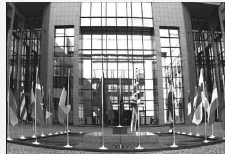
Eingang Europäisches Ratsgebäude

Die erste Frage ist jene nach der Natur und dem Ziel des Integrationsprojektes unter den heutigen Umständen. Kann und soll die erweiterte und sich noch erweiternde Union das Projekt der Gründer weiterverfolgen, das heißt den schrittweisen Ausbau der supranationalen Strukturen und Verfahren, verbunden mit Souveränitätsübertragungen von den Mitglieds-