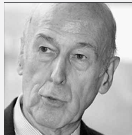
Giscard d'Estaing, Präsident des EU-Verfassungskonvents

bezieht sich aber bisher ausschließlich auf die Frage der Erfüllung der politischen und wirtschaftlichen Kriterien durch die Türkei.