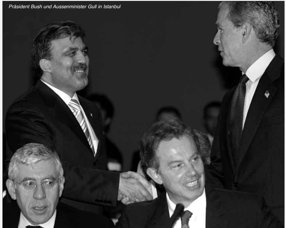
Präsident Bush und Aussenminister Gull in Istanbul

denen Kultur geprägten großen Landes, wie die Türkei, das derzeit 68 Mio. Einwohner hat und in wenigen Jahrzehnten 100 Millionen Einwohner haben wird, für die Europäische Union und ihre weitere Entwicklung? Wird durch die Aufnahme der Türkei das in Bau befindliche Projekt „Politische Union“ gefährdet und unmöglich