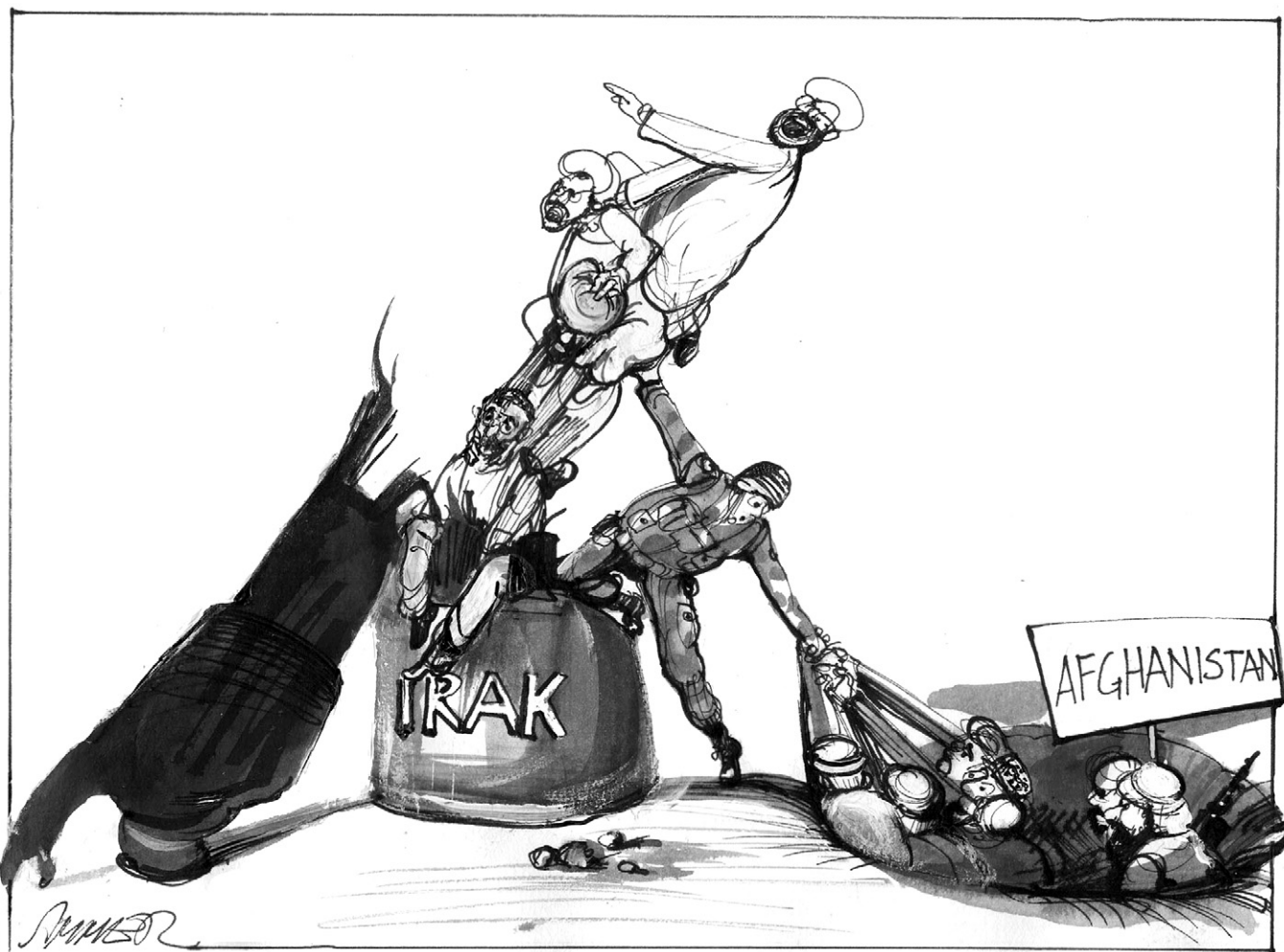
Karikatur: „Wiener Zeitung“/Wolfgang Ammer

Herr Fischer ist ein guter Präsident, Pröll überlegt, ob er ihn schlagen könnt' – die „Kronen Zeitung“ sponsert den Versuch – ich glaub', da hebt sich Dichand einen Bruch.